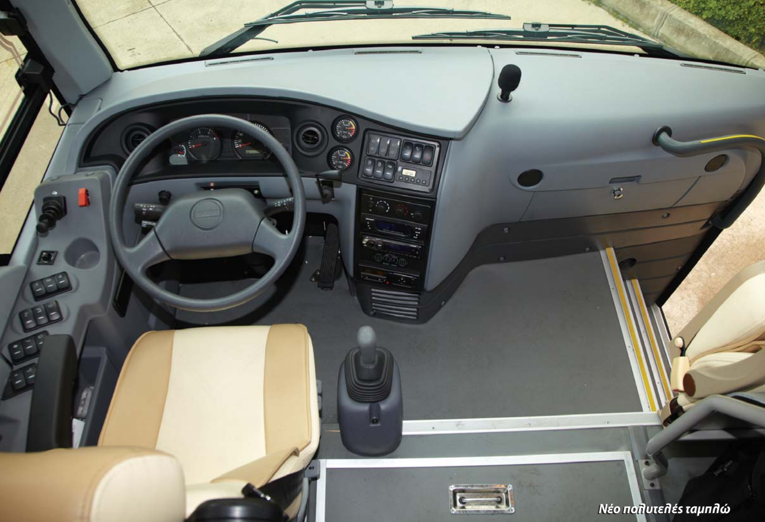
Νέο πολυτελές ταμπλό

Το Isuzu POLIS φροντίζει τους οδηγούς, αυτούς που ξεδεύουν τον μεγαλύτερο μέρος του χρόνου τους στους δρόμους... αυτούς που εργάζονται με πλήρη αφοσίωση ώστε να εξασφαλιστεί ένα ασφαλές και άνετο ταξίδι για τους επιβάτες του λεωφορείου.